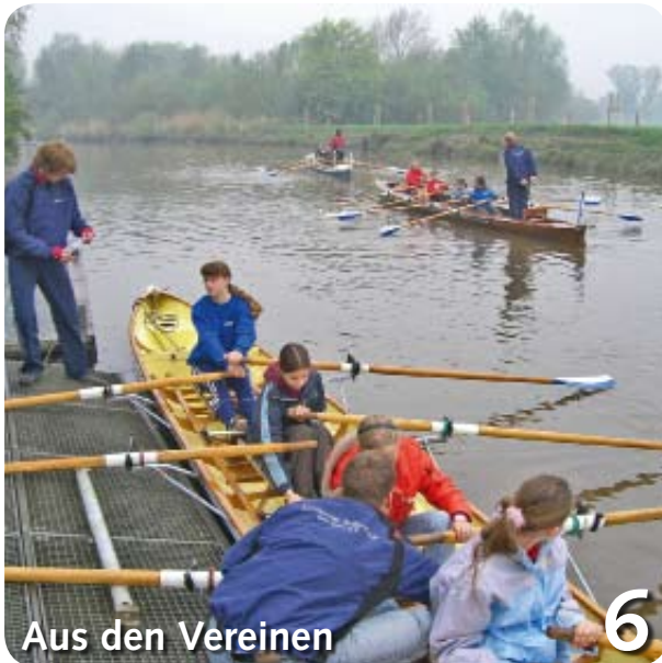
Aus den Vereinen 6