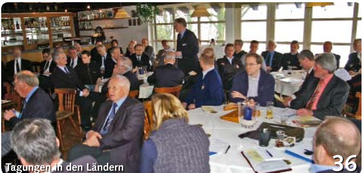
Tagungen in den Ländern 36