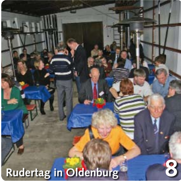
Rudertag in Oldenburg 8