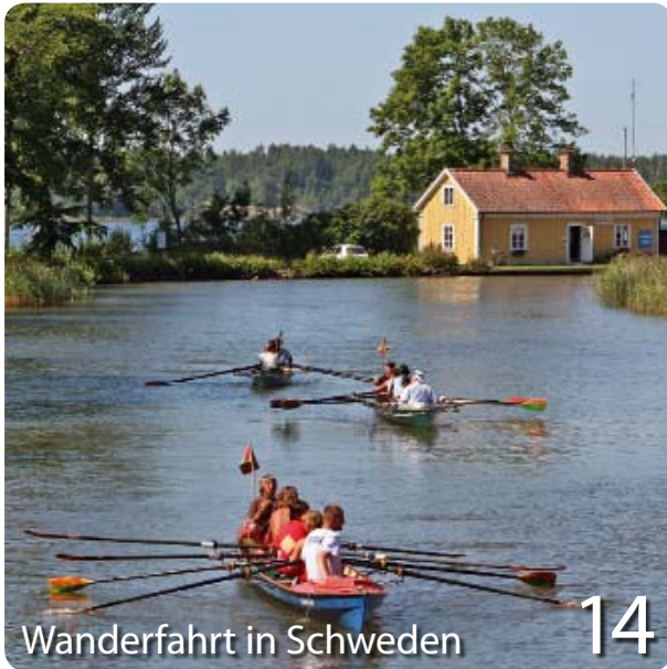
Wanderfahrt in Schweden 14